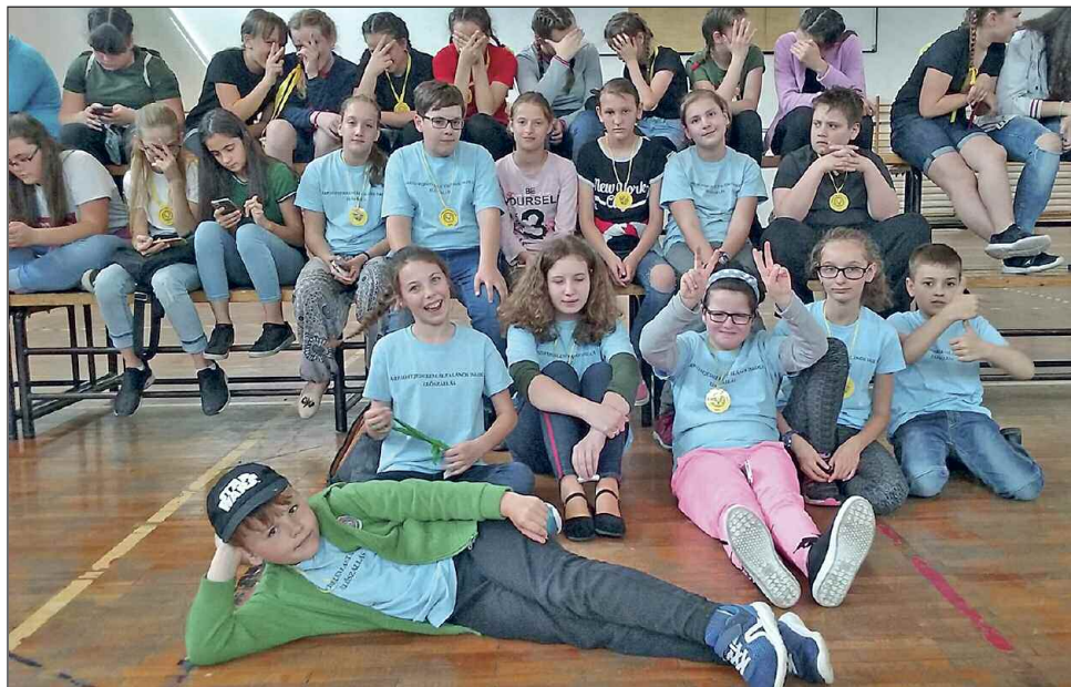
Eredményre vár a színjátszó csoport