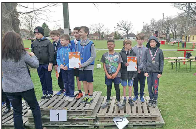
II. korcsoportos fiúk