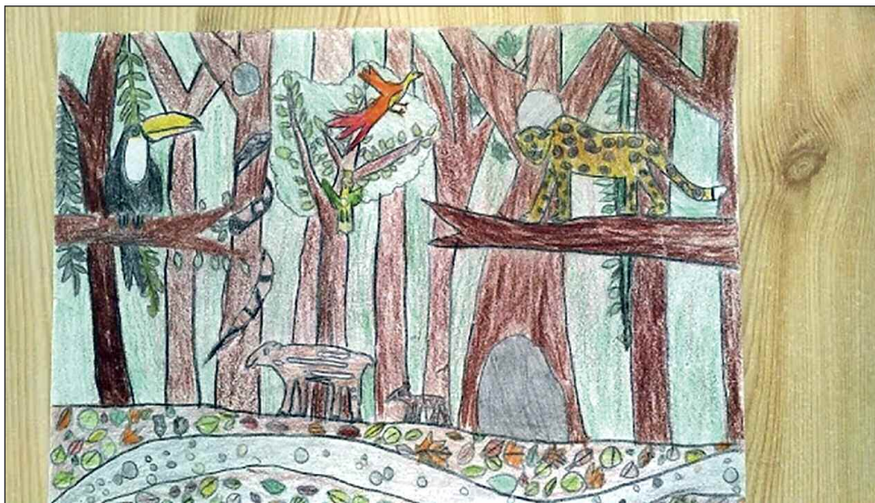
Farkas Luca rajza