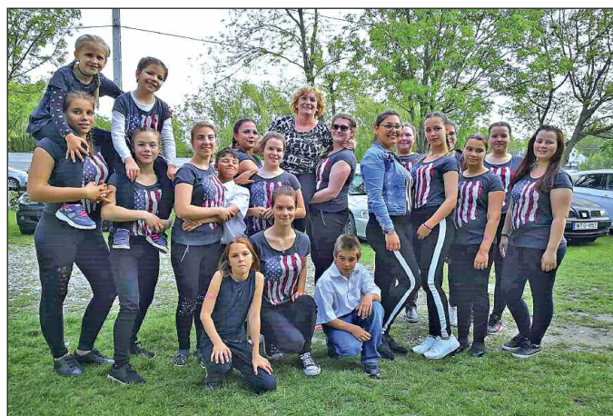
Gett Dance táncsoport

Tehetséges diákjaink közül a Gett Dance táncsoport és a rajz szakkörösök három legfiatalabb tanulója mutatkozott be Dunaújvárosban a Tehetségnapon.